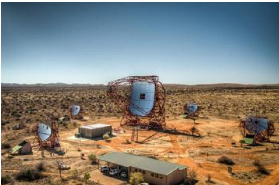
Le réseau de télescopes HESS-II en Namibie.

La Voie Lactée recèle de nombreux pulsars, et la situation de HESS-II en Namibie permet d'explorer les régions centrales de notre Galaxie. Les données récoltées par HESS-II démontrent la faculté pour ces télescopes d'explorer et de dévoiler bon nombre des grands mystères de l'Univers.